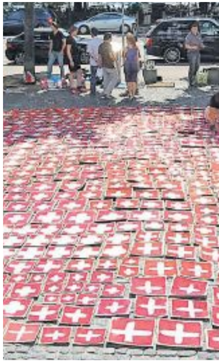
Flaggen sollen zum Denken anregen.