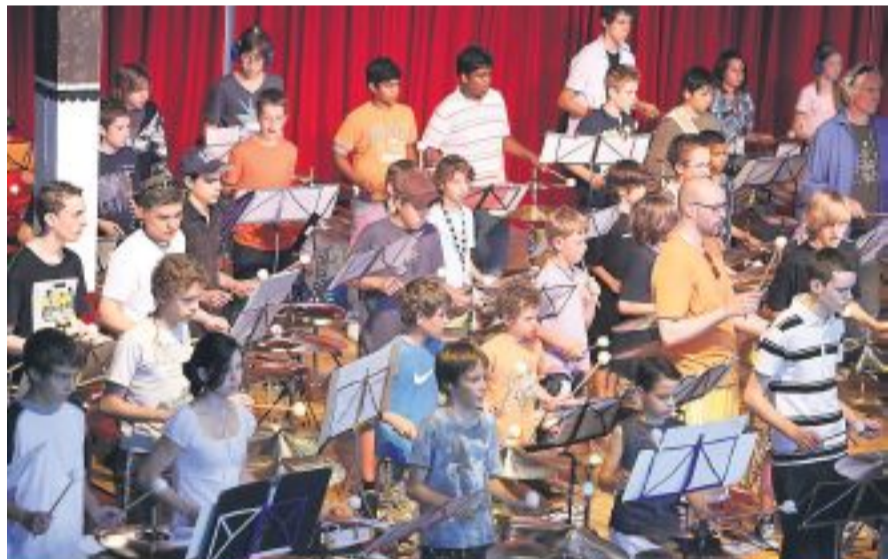
200 Musikschüler trommelten im Schützenhaus Albisgütli.

Mit 14 000 Schülerinnen und Schülern ist die Musikschule der Stadt Zürich die grösste Musikschule in Europa. Auch Stadtrat Gerold Lauber, der das Patronat für diesen Anlass übernommen hatte, war schon vorher überzeugt: «Mit diesem Anlass untermauert die Stadt Zürich ihren Ruf als Bildungs- und Kulturstadt.» (roc)